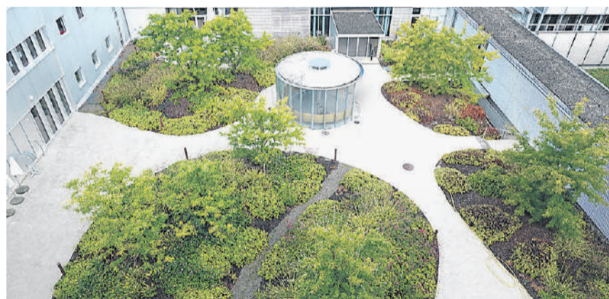
Die Reha Rheinfelden wurde erneut ausgezeichnet.

Dass die Weihnachtszeit im Städtli einen Besuch lohnt, zeigt das vielfältige Programm: Seit dem 25. November präsentiert sich die Altstadt in festlichem Gewand. Die Weihnachtsbeleuchtung taucht die Altstadt in funkelndes Licht; die beiden grossen Weihnachtsbäume vor dem Rathaus und im Innenhof sind bunt geschmückt. Musikgruppen und Chöre spielen und singen an verschiedenen Orten und erfüllen die Marktgasse sowie diverse Lokale mit festlichen Klängen – ganz nach dem Jahresmotto «Rhyfælde tönt guet». Im Stadtpark West, in unmittelbarer Nähe zur Altstadt, hat die Buvette «Rhybar» ihr Winterquartier aufgeschlagen. Bei einem heissen Tee oder Glühwein und kleinen Snacks geniessen die Grossen den Advent, derweil die Kleinen im Bastelwagen Weihnachtliches kreieren oder im Knusperhäuschen einem Märli zuhören dürfen. (mgt)