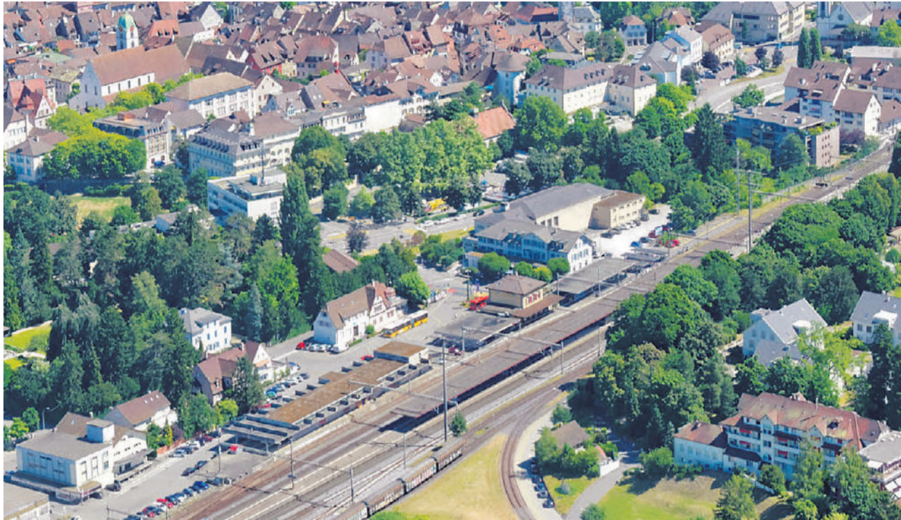
Wie sieht die Zukunft beim Rheinfelder Bahnhof aus? Die Bevölkerung kann sich ab Januar an der Mitwirkung beteiligen.

Zum Dritten gehört der Roniger-Park, direkt an den Bahnhofsplatz angrenzend, zum Entwicklungs-